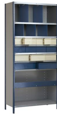
ESTANTES COM GAVETAS DIVISORES E DETENTORES