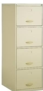
04-PS 04-PS JUNIOR PATINS DE NYLON