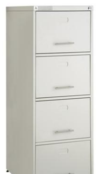
04-C PREMIUM CARRINHO TELESCÓPICO COM MICRO ESFERAS