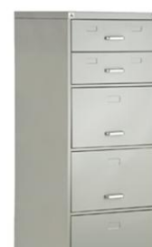
MO-5-C FICHA/PASTA SUSPensa