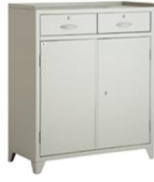
AFD-ARMÁRIO FERRAMENTEIRO DUPLO