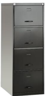
04-P PATINS DE NYLON