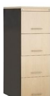
04-MC AÇO E MADEIRA