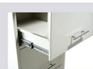
CARRINHO TELESCÓPICO COM MICRO ESFERAS