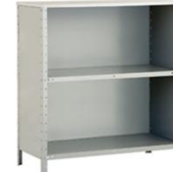
BC BALCÃO FECHADO