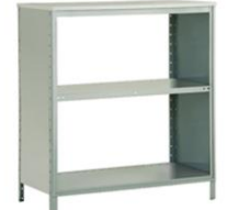
BV BALCÃO C/ MOLDURA PARA VIDRO