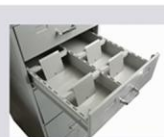
COMPRESSOR PARA FICHAS